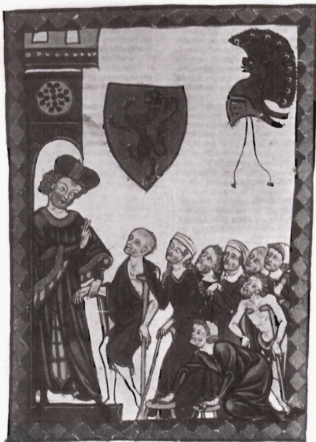
Los hospitales de la Iglesia en la Edad Media practicaban una asistencia médica caritativa.

4) Los antecedentes de la Seguridad Social hay que buscarlos en la Ley de Accidentes del Trabajo de 30 de enero de 1930 y en la creación del Instituto Nacional de Previsión en 1908. Años antes, en 1883, se habían establecido por Bismarck en Alemania los primeros seguros obligatorios de enfermedad. En nuestro país, el primer seguro social que se establece con carácter obligatorio es el de Régimen de Retiro Obrero Obligatorio en 1919. Más tarde, en 1929, se introduce el Seguro Obligatorio de Maternidad, al que se añadió en 1940 la Obra Maternal e Infantil. En 1929 se promulgó una legislación protectora frente a los accidentes de trabajo en el mar que se completó con disposiciones semejantes de protección laboral en la agricultura (1931) y en la industria (1932). Se estableció la obligatoriedad del seguro para los riesgos de incapacidad permanente y muerte, siendo voluntario para la incapacidad temporal.