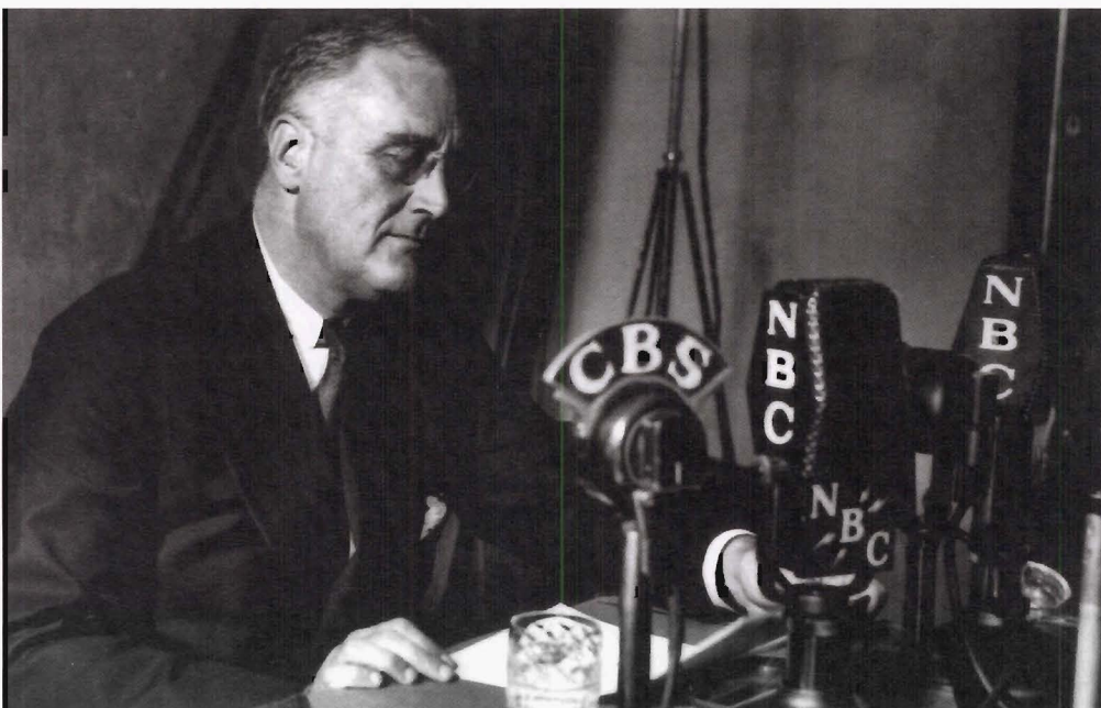
F. D. Roosevelt, 14 de agosto de 1935, Social Security Act