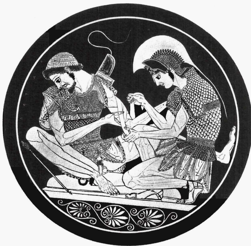
Aquiles vendando al herido Patroclo. Copa de Sosias, atribuida a Euphronio, de estilo ático finales del s.VI, principios del s. V a.C.

En 1968, los hospitales más importantes del país que estaban implicados en la formación de especialistas constituyeron el llamado "Seminario de hospitales con programas de posgraduados". Este seminario, que nació como una asociación voluntaria de hospitales, realizó varias reuniones en diferentes provincias españolas estableciendo ciertas normas generales con las cuales, poco a poco, se fueron unificando los programas formativos y se iniciaron los procedimientos de acreditación docente en los hospitales afiliados. El influjo que el seminario de hospitales tuvo en el país fue muy grande y, a pesar de sus pocos años de existencia, dió lugar a un cambio notable en la mentalidad de otros hospitales, que vieron en la actividad docente un gran estímulo para mejorar su calidad asistencial. La convocatoria anual de plazas de residentes se hacía al principio por cada hospital de manera aislada, hasta que en 1972 la Seguridad Social, que financiaba en su mayor parte la formación, comenzó a realizar convocato-