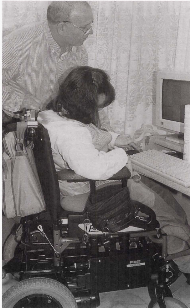
La asistencia médica tecnológica.

arquitectónico, se imita la estructura y el funcionamiento de los sanatorios privados, y para evitar la denominación peyorativa de hospital, se les denomina residencias. La hospitalización era sólo de casos quirúrgicos, ingresando cada cirujano al enfermo que había de operar, sin que se aprovechara su experiencia para el conjunto ni para la enseñanza de la Medicina.